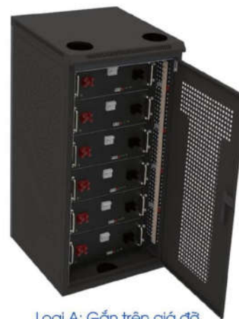
Loại A: Gắn trên giá đỡ