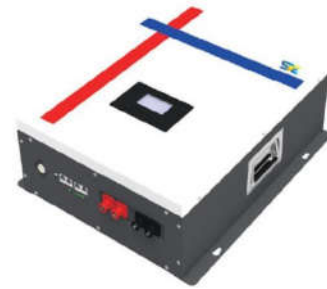
Loại B: Treo tường SVE 5000WM