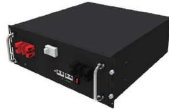
Loại A: Gắn trên giá đỡ SVE 5000RM